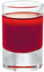
AIDA HOT LIPS